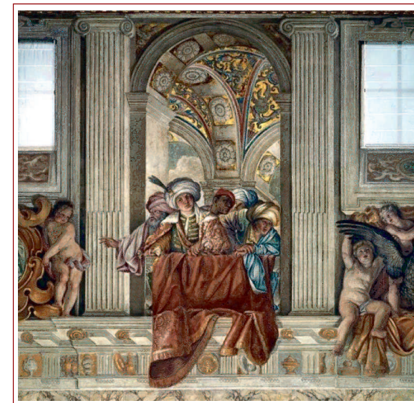
Carlo Saraceni: Ambasciata persiana guidata da Sir Robert Shirley, Salone dei Corazzieri, Palazzo dei Quirinale, 1616